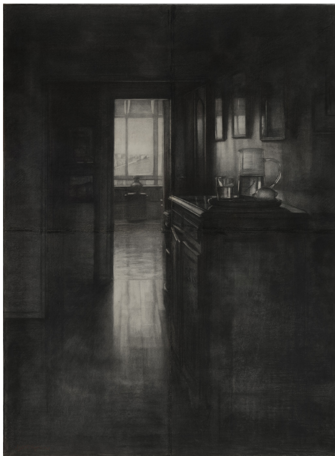
Ombre et lumière, Série Intérieurs, 2003 Fusain sur papier, 156x116 cm ©Szeto Lap & Guangda Museum

VERNISSAGE EN PRÉSENCE DE L'ARTISTE – JEUDI 13 JUIN