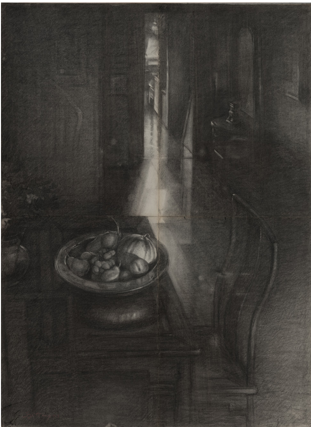
38°5, le matin, Série Intérieurs, 2003 Fusain sur papier, 156x116 cm ©Szeto Lap & Guangda Museum