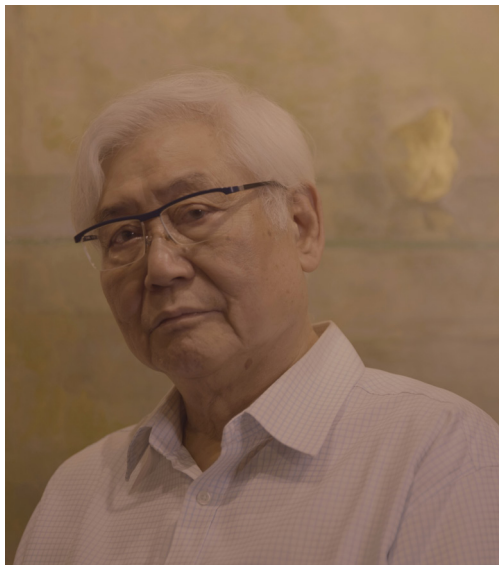
Szeto Lap, 2024

Né à Canton en 1949, Szeto Lap, s'installe à Hong-Kong en 1972 avant de s'établir en 1975 à Paris, ville qui lui offre sa première exposition individuelle en 1979.