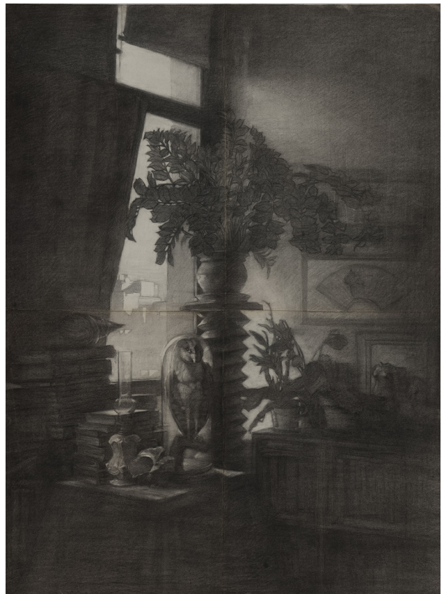
L'angle de l'atelier, Série Intérieurs, 2003 Fusain sur papier, 156x116 cm ©Szeto Lap & Guangda Museum