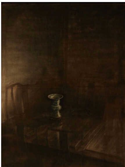
Intérieur au vase I, 1992 Fusain et aquarelle sur papier, 155x115 cm ©Szeto Lap & Collection privée

« Szeto Lap effectue une synthèse très personnelle entre la pensée taoïste, la tradition picturale et poétique chinoise et la modernité occidentale, artistique et philosophique. Son parcours de création, radical et sans concession, s'apparente à une longue méditation à la recherche d'une esthétique permettant de manifester l'existant en transformation perpétuelle, de révéler l'impermanence des choses, entre visible et invisible, voilement et dévoilement. L'hypnotique jeu d'ombre et de lumière des fusains de la série « Intérieurs », autant que les chefs-d'œuvre à l'huile tels que « Le couloir », manifestent ce mélange de sérénité et de mystère, de quiétude et de doute, qui se dégagent des œuvres de Szeto Lap. « La vérité de la peinture se situe entre l'être et le néant », Szeto Lap, qui explore inlassablement l'énigme de la présence, pourrait faire sienne cette affirmation de Giacometti ». (Myriam Kryger, commissaire de l'exposition)