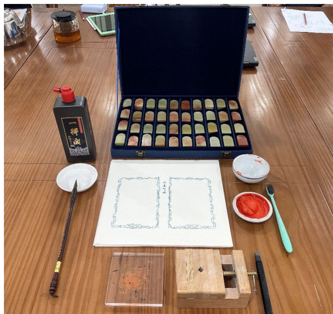
Les matériaux préparés par l'ECNU