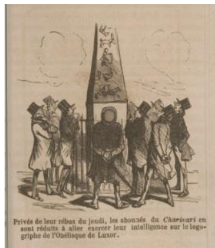
Le Charivari , 14 déc. 1851

Qu'est-ce qu'un hiéroglyphe pour les dessinateurs et humoristes ? La presse satirique reproduit-elle de véritables hiéroglyphes égyptiens ? Comment les dessinateurs conçoivent-ils leurs propres hiéroglyphes ?